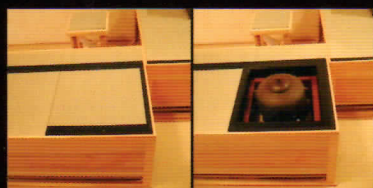
風炉点前などの際には、もちろん炉置(写真左)を入れられます。