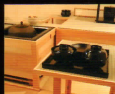
茶懐石などを通して、亭主とのやり取りを楽しめます。