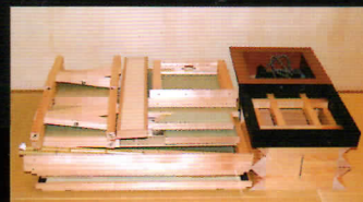
全て折りたたんだ状態。炉を含めても非常にコンパクト。収納や移動も簡単です。