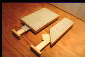
建水台(左)と柄杓台(右) 風炉点前の際には写真のように取り外し可能です。

これまでは椅子座の点前＝立礼という考え方が主流でしたが、この椅子茶席では通常のお茶室と同様に、様々なお点前を楽しむことができます。